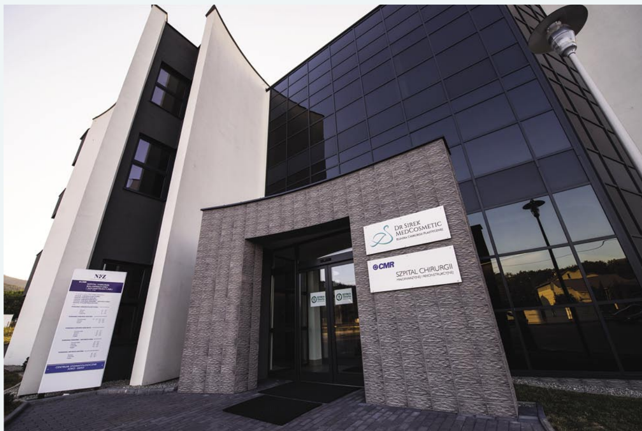
KLINIKA DR SIREK MEDCOSMETIC POŁOŻONA JEST W NAJPIĘKNIEJSZEJ DZIELNICY BIELSKA-BIAŁEJ, U STÓP SZYNDZIELNI